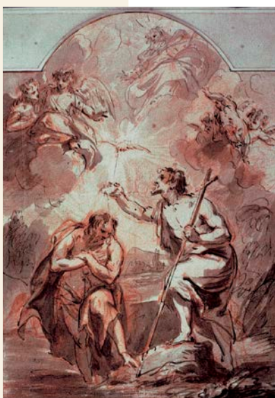
Jacob de Wit, Doop van Jezus in de Jordaan , schets voor altaarstuk, gemengde techniek, ca. 1716.

Jacob de Wit is vooral bekend van zijn plafondstukken, met name in de Amsterdamse grachtengordel. 'Je kon bij hem terecht voor een heel interieurprogramma. Hij had daarvoor een heel goedlopend atelier, een beetje vergelijkbaar met dat van Rubens. Verder was hij beroemd om zijn 'Witjes': schilderijen met de illusie van beeldhouwwerk.' In 1995 wijdde Museum Ons' Lieve Heer op Solder een grote tentoonstelling aan De Wit, onder de titel Putti en Cherubijntjes. Sindsdien kocht het museum her en der werken van de schilder aan, die afgelopen maanden dus even uit het depot kwamen. De conservator hoopt dat na het Bijbels Museum (met een expositie in 2000) het Rijksmuseum nog eens aandacht aan De Wit schenkt. 'Ooit was hij de beroemdste Amsterdamse schilder. Zijn werk is levendig, beweeglijk. Het heeft frisheid en vrolijkheid.'