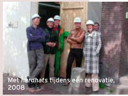
Met hardhats tijdens een renovatie, 2008