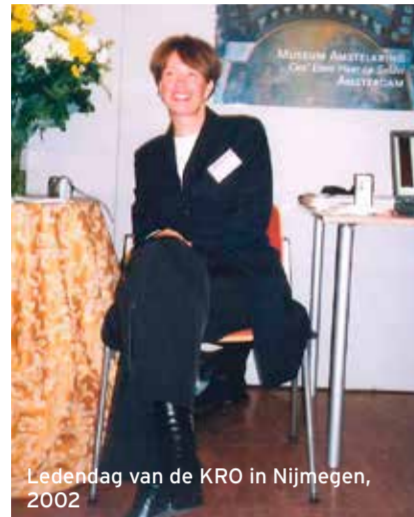
Ledendag van de KRO in Nijmegen, 2002