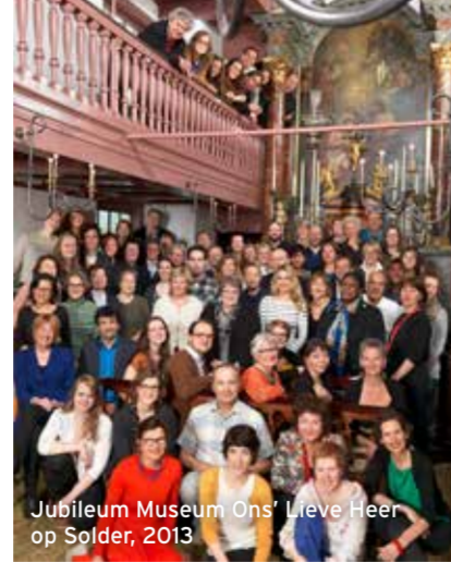
Jubileum Museum Ons' Lieve Heer op Solder, 2013