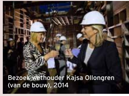
Bezoek wethouder Kajsja Ollongren (van de bouw), 2014