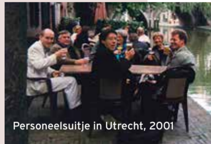
Personeelsuitje in Utrecht, 2001