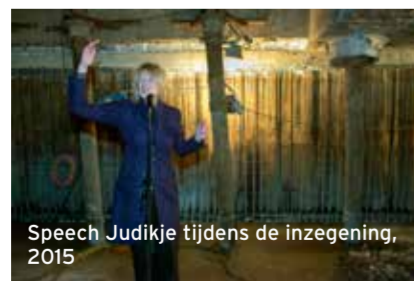
Speech Judikje tijdens de inzegening, 2015