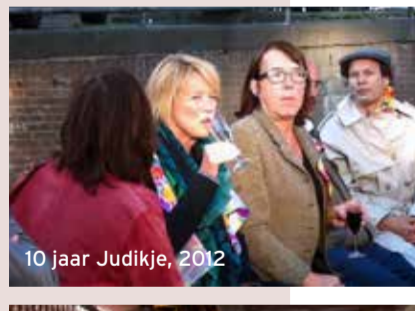
10 jaar Judikje, 2012