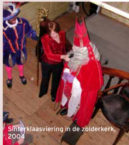
Sinterklaasviering in de zolderkerk, 2004