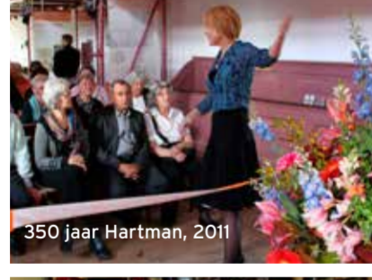
350 jaar Hartman, 2011