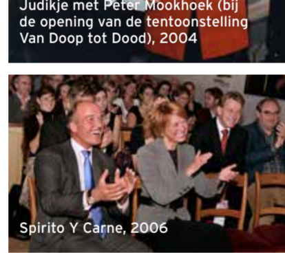
Spirito Y Carne, 2006