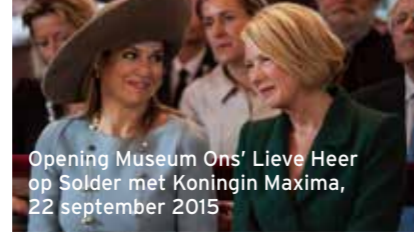
Opening Museum Ons' Lieve Heer op Solder met Koningin Máxima, 22 september 2015