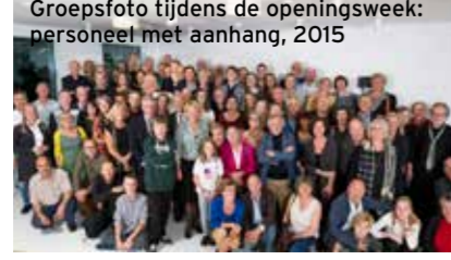
Groepsfoto tijdens de openingsweek: personeel met aanhang, 2015