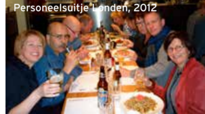
Personeelsuitje Londen, 2012