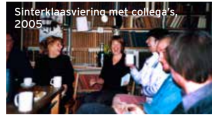
Sinterklaasviering met collega's, 2005