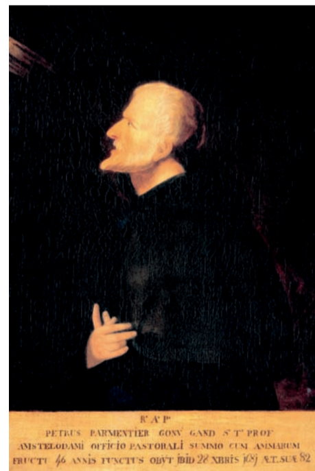
Onbekende kunstenaar, Petrus Parmentier , 1681. Olieverf op doek, 97,7 x 56,8 cm. Collectie Museum Ons' Lieve Heer op Solder. Bruikleen parochie Sint Augustinus 'De Star', Amsterdam.

Het kost veel tijd en energie, geeft Boers toe, maar dat is het waard. “Het is onderzoek naar een religieuze minderheid in Amsterdam. Het is een micro-geschiedenis die niet gaat over regenten of het patriciaat – daarover zijn al vele boeken volgeschreven – maar over gewone mensen. Dat maakt het een stuk lastiger, maar ook boeiender.”