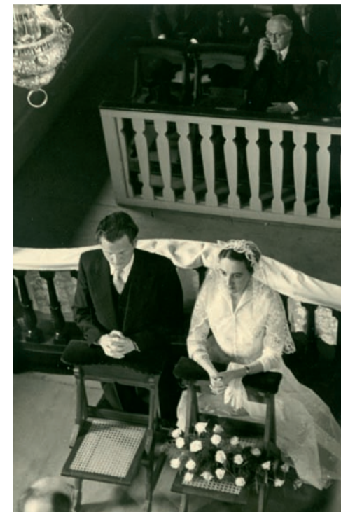
3 juli 1954

Eerstvolgende Solderviering zondag 4 december om 11.00 uur.