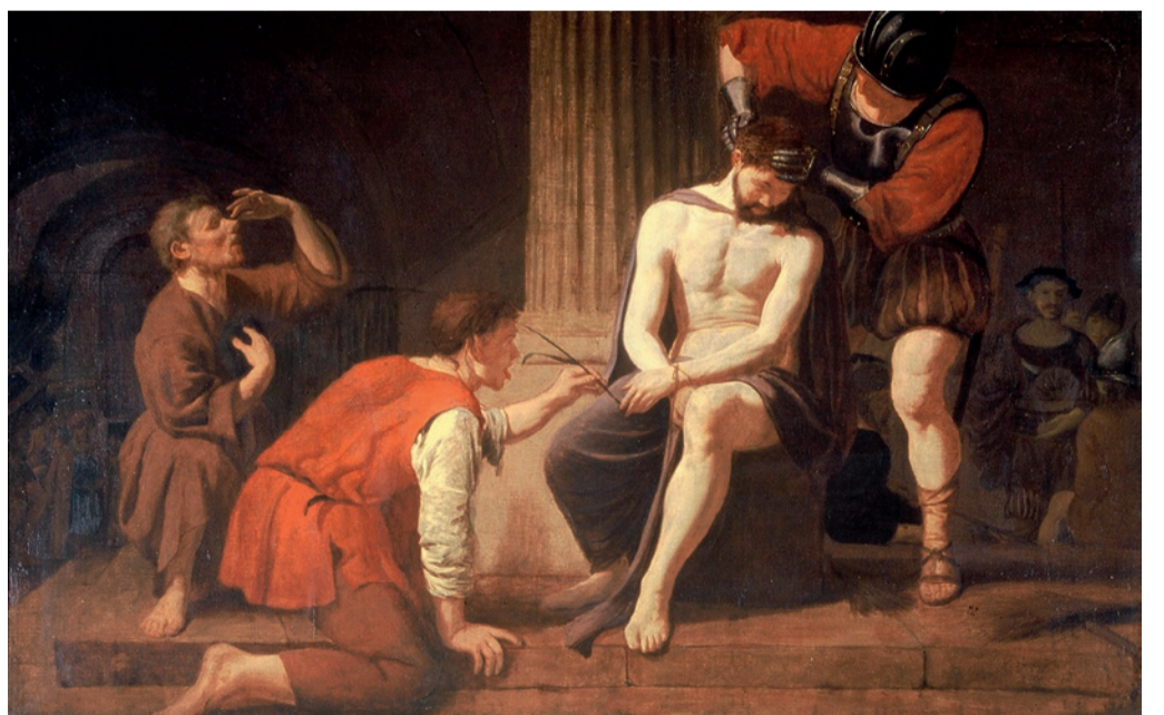
Adriaen van de Velde, De Doornkroning , 1664, olieverf op doek