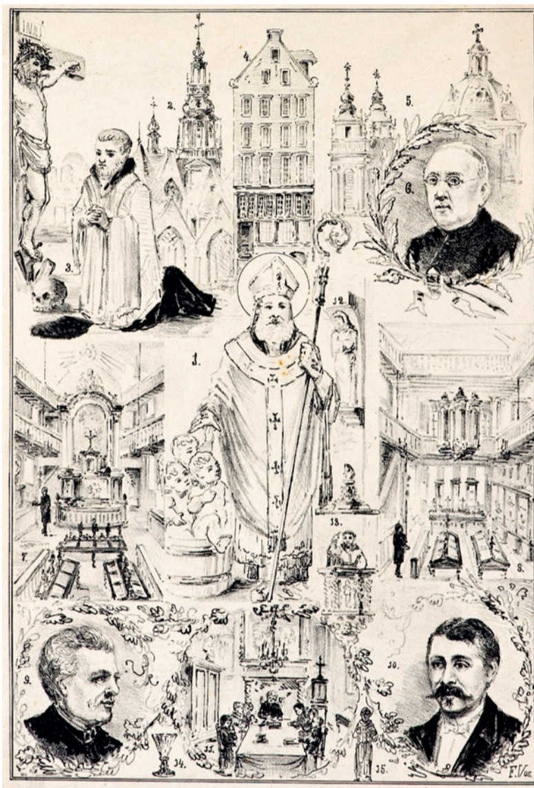
‘Ter Feestelijke opening van het Museum Amstelkring op 24 april 1888’