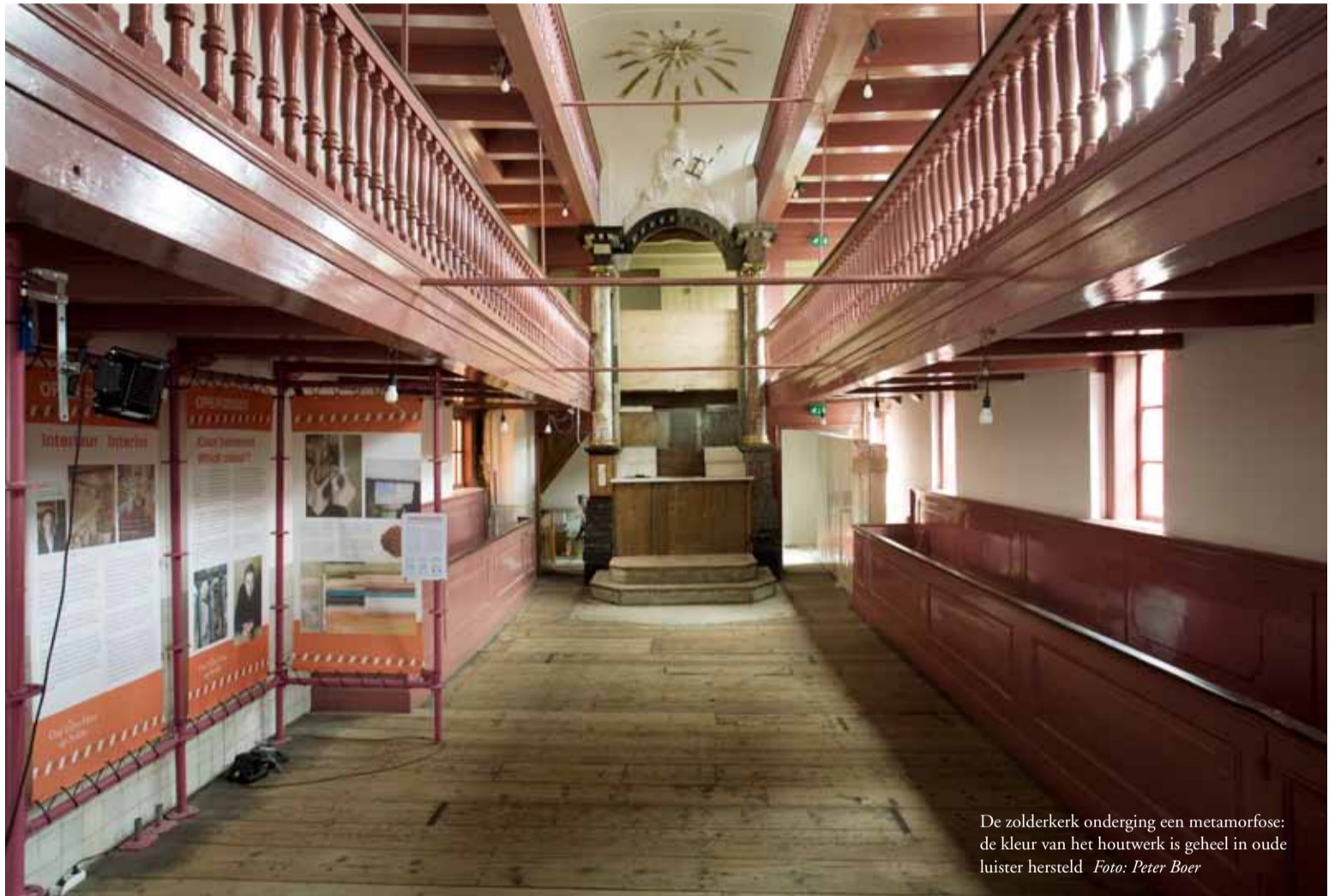
De zolderkerk onderging een metamorfose: de kleur van het houtwerk is geheel in oude luister hersteld.