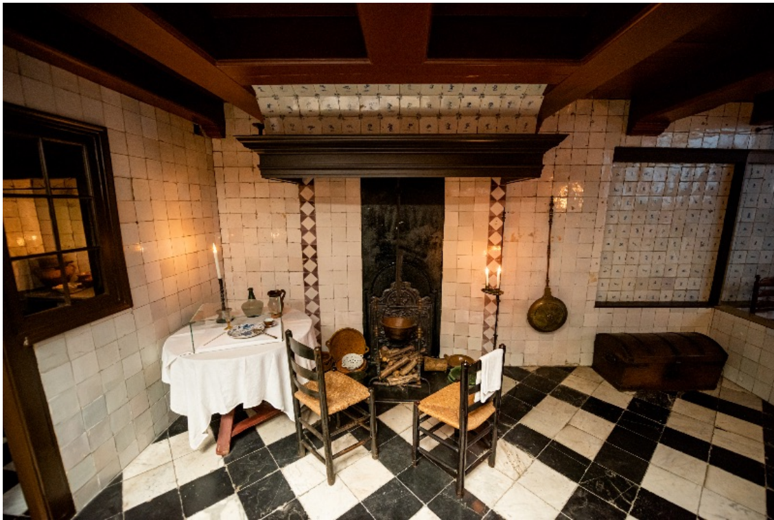
De 17de-eeuwse keuken in de steenwoning.